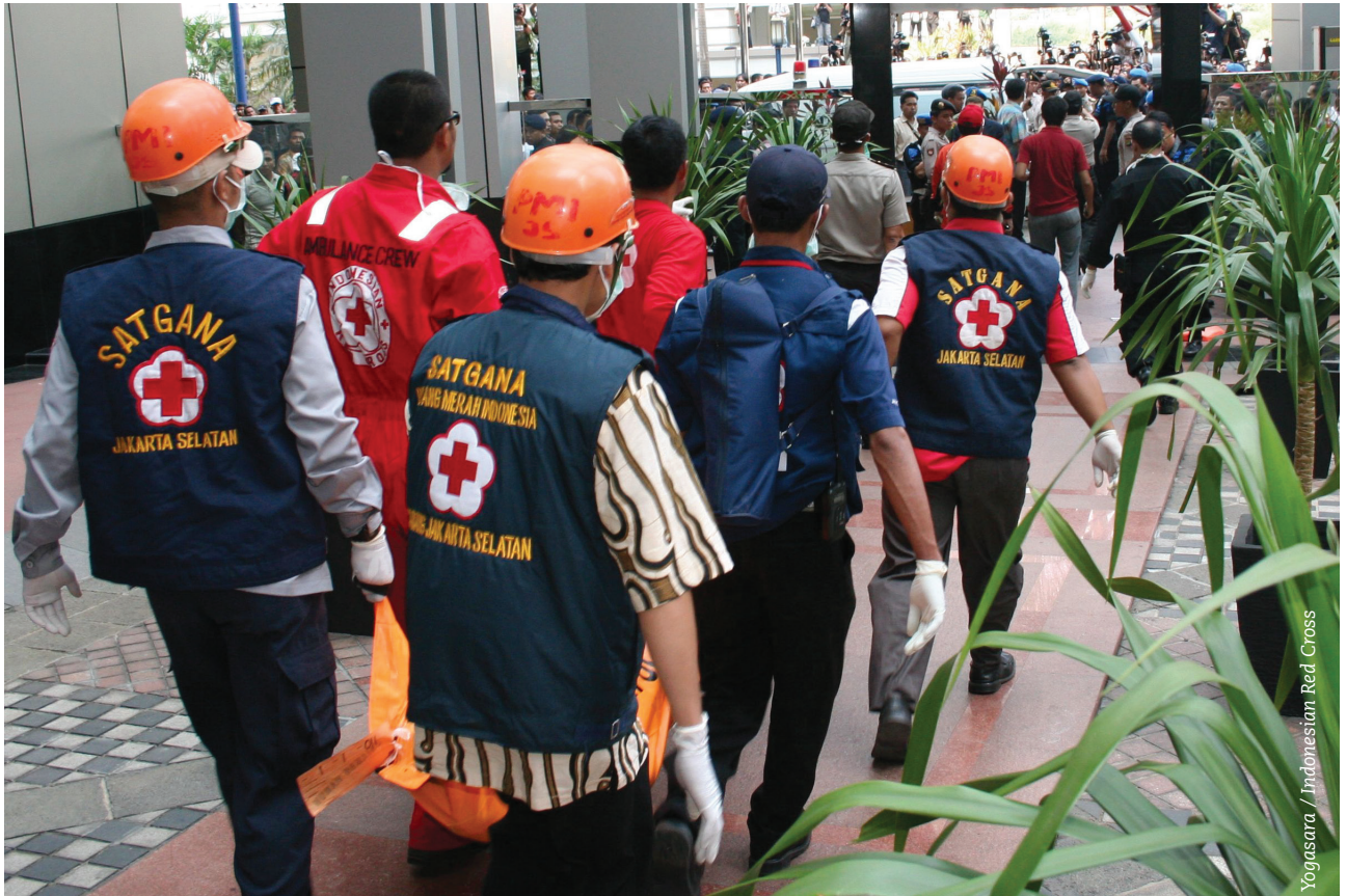
Yogasara / Indonesian Red Cross

Hay dos abordajes amplios al voluntariado dentro del Movimiento que se ven reflejados en el voluntariado en emergencias: