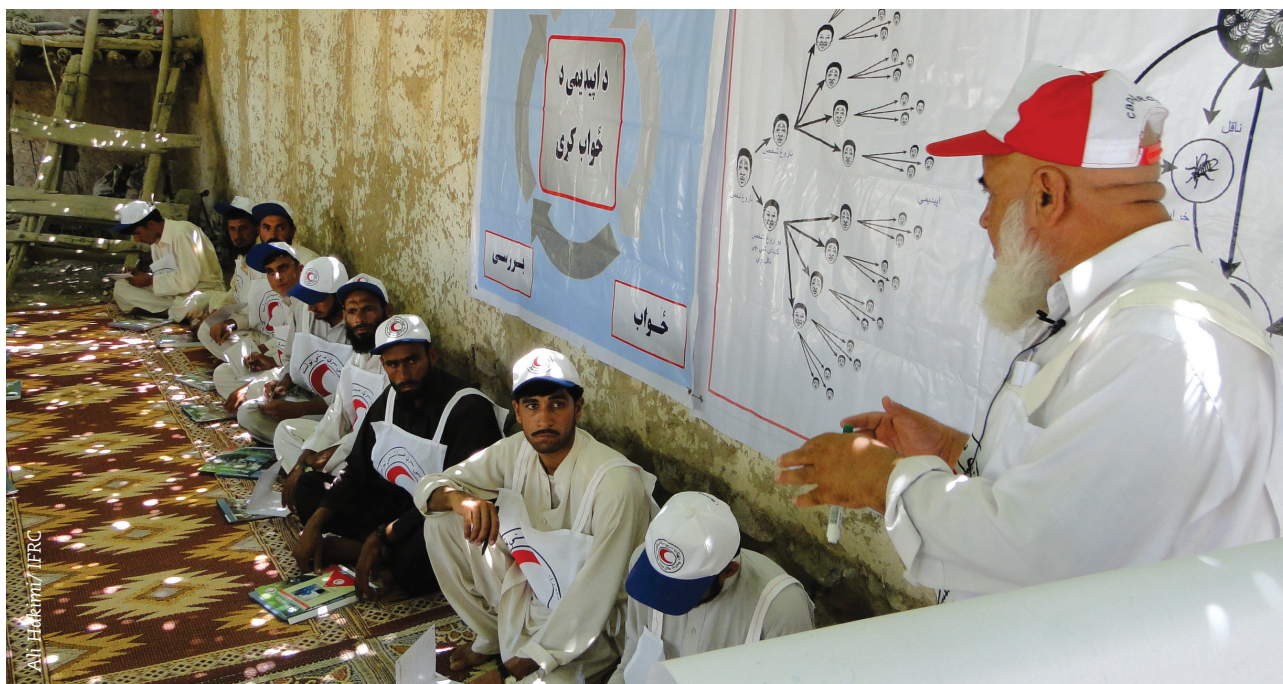
Formación de los voluntarios de la comunidad en temas de agua y saneamiento dado por la Media Luna Roja de Afganistán.